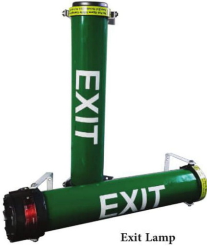
Exit Lamp Exit Lambası